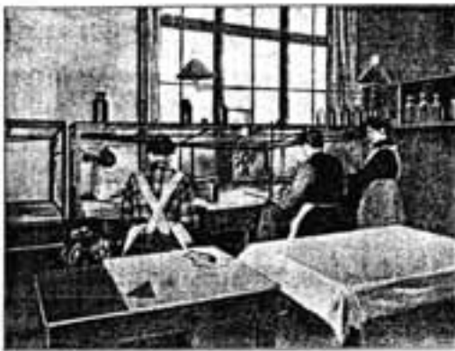
Высасывающий вентилятор непосредственно над рабочим столом, так предотвращает опасность взрыва, предотвращая забрызгивание вентилятора.