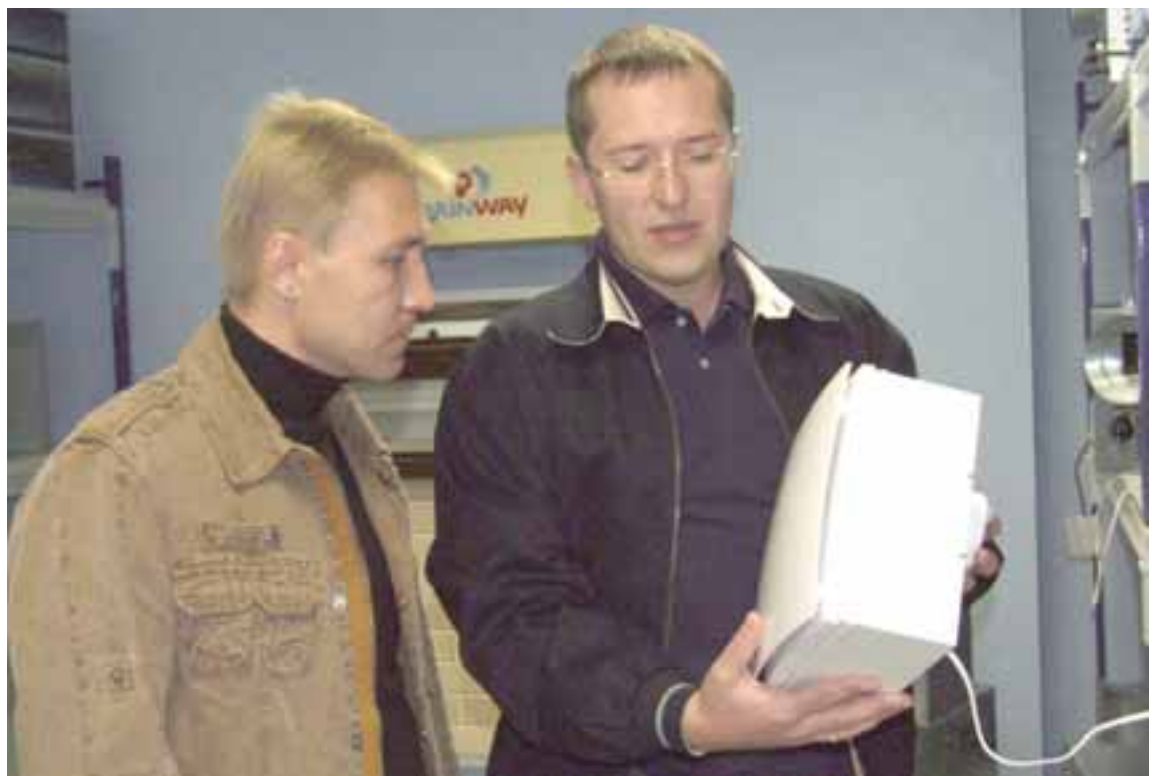
Изучение модифицированных единиц продукции «ВЕНТС» с сотрудниками торгового отдела

Всем известно, что сегодня для уверенности в том, что товар будет куплен, недостаточно просто выложить его на полку магазина, потребитель хочет получить вместе с красивой представленной продукцией исчерпывающую консультацию о том, как работают приборы, каковы преимущества данной торговой марки и многое другое. И тут возникает вопрос: «Где найти столько квалифицированных продавцов-консультантов?». Поэтому мы занимаемся обучением и воспитанием новичков. И как результат, в Запорожском регионе, где мы начинали, ТМ «ВЕНТС» занимает в розничной сети более 95 процентов продаж систем вентиляции. В результате этого, немногочисленные конкуренты, установив свои торговые стенды, через несколько месяцев просто оставляют их, а на освободившихся торговых площадях работники магазинов выкладывают продукцию ТМ «ВЕНТС».