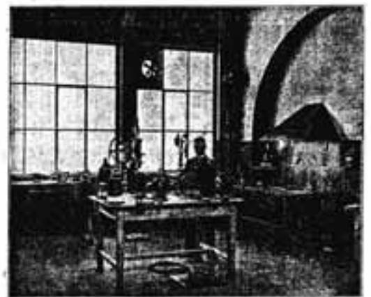
Кружок с вышкой в 4 горны, вентилятор.