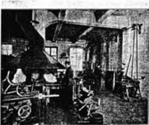
Кружок с вышкой в 4 горны.