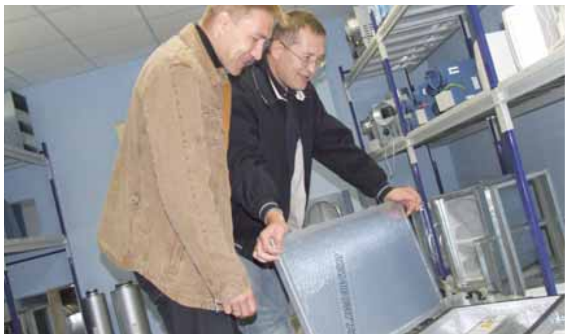
Знакомство с опытными образцами приточно-вытяжной вентиляции

– На самом деле никаких скрытых приемов работы и секретов нет. На протяжении всех лет нашей работы в регионах мы очень тесно взаимодействуем с большинством строительно-монтажных предприятий. По их заказу мы осуществляем целевые поставки крупных партий систем вентиляции. Очень часто подряд на монтаж вентиляции получает непосредственно наша компания. В этом случае мы привлекаем к работе монтажные бригады, однако весь процесс проходит под нашим непосредственным контролем до момента ввода системы в эксплуатацию. «Компания Вент Аэр» очень дорожит достигну-