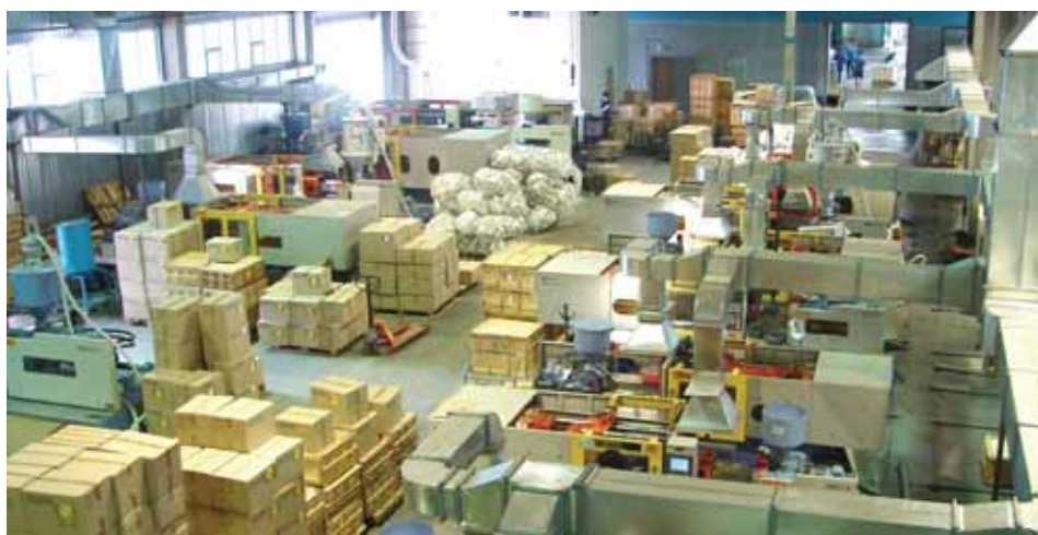
Новые высокотехнологичные термопластавтоматы с ЧПУ

идет круглосуточно, что позволяет использовать и оборудование, и человеческий ресурс наиболее эффективно.