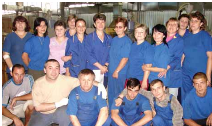
Дружный коллектив литейного цеха