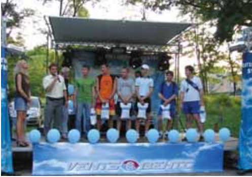
Награждение победителей (команда «Молодежка»)

28 июня в парке Победы г. Боярки состоялся праздник, посвященный Дню Конституции. Организатором мероприятия стала мэрия г. Боярки при активном участии компании «Вентиляционные системы». В рамках фестиваля прошли соревнования по волейболу на Кубок мэра. Почетное первое место заняла команда «Молодежка», второй приз завоевали «Ветераны», третье – воспитанники ДЮСШ.