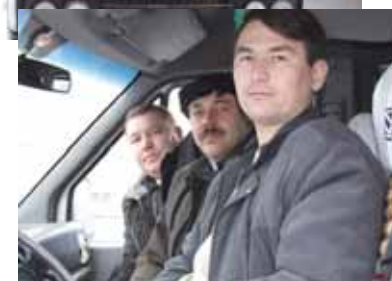
Транспорт и водители...

сается качества работы, то ее уровень зависит от активного диалога между сотрудниками и администрацией предприятия, где ждут предложений для оптимизации работы транспортных маршрутов.