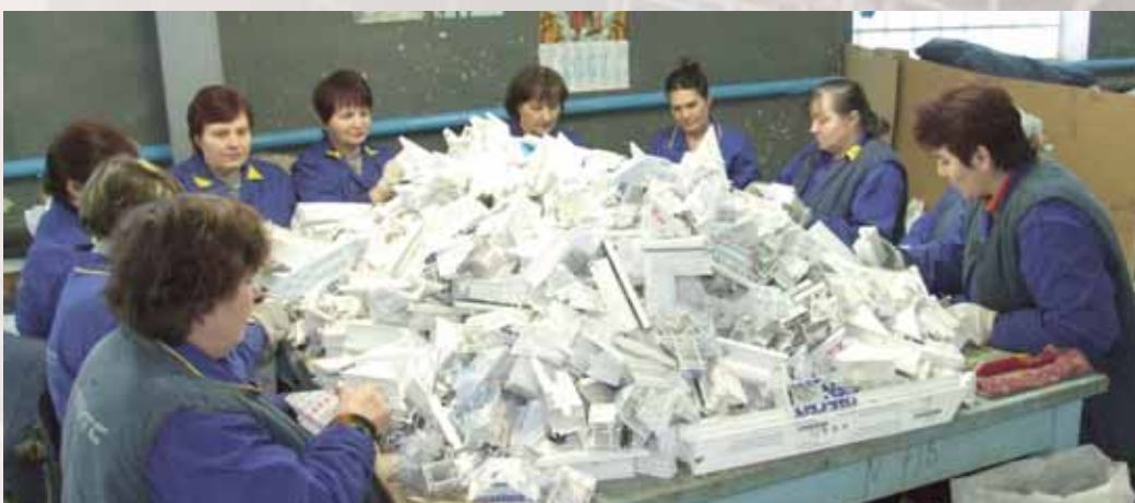
Бригада по сортировке и первичной обработке сырья