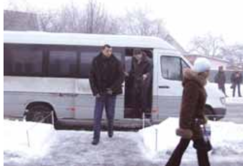
Прибыла первая смена...

Для удобства сотрудников компании, проживающих в г. Ирпене, запланирован новый маршрут, «ВЕНТС» – г. Ирпене, который будет доставлять персонал до места работы и обратно бесплатно. Заселение в общежитие планируется в марте 2007 года. За более подробной информацией можно обратиться в отдел кадров: 8(298) 47-014 и 8(044) 406-36-26.